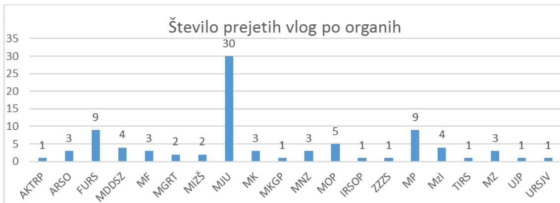
Graf 1: Število prejetih vlog po organih