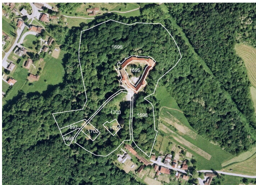
Slika 2. Zemljišča, dodeljena v upravljanje JZ KPG s sklepom o ustanovitvi.

Ob ustanovitvi je bilo JZ KPG s sklepom dodeljeno upravljanje zemljišč s parc. št. k. o. Grad 1695, 1696, 1697, 1698, 1701, 1702, 1703 v skupni velikosti 8,3 hektarja (slika 2), ki obsegajo kulturni spomenik državnega pomena, grad Grad z grajskim parkom in gozdom. V gradu vključno z grajskim parkom, ki je nepremičnina v državni lasti, so delovni prostori JZ KPG in središče za obiskovalce KPG.