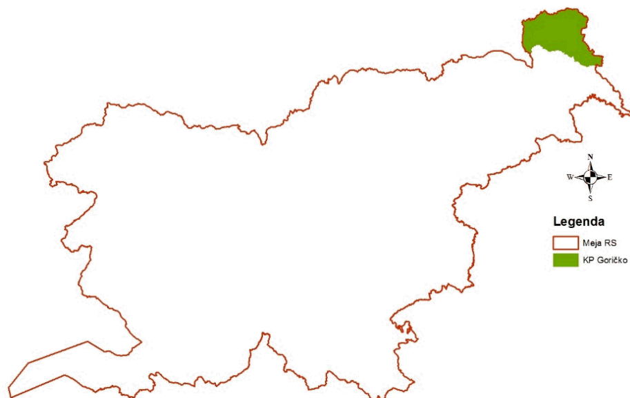
Slika 1. Lega zavarovanega območja KPG v Sloveniji.

KPG leži na severovzhodu Slovenije ob meji z Avstrijo in Madžarsko (slika 1). Obsega 46.252 hektarjev in je največji krajinski park v Sloveniji ter je del čezmejnega Trideželnega parka Goričko - Raab - Órség med Slovenijo, Avstrijo in Madžarsko.